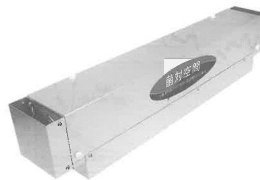
新商品の「菌対空間」

また、景観舗装資材では、「意匠性と機能性のある舗装施工材」の企画・開発・製造・販売を通じて、景観と環境に配慮した街づくりと豊かな暮らしの実現に貢献することを使命と考え、お客様から好評を得ている「リリースペイント」で、全国のアスファルト舗装をこれまでの黒から景観にマッチし、それぞれのコンセプトに合わせたデザインやカラーで彩っていきたくと思っています。そして、当社が注力している「リリースペイント」で、アスファルト舗装用の水性塗料として、お客様からNO.1の評価を頂くことが目標です。