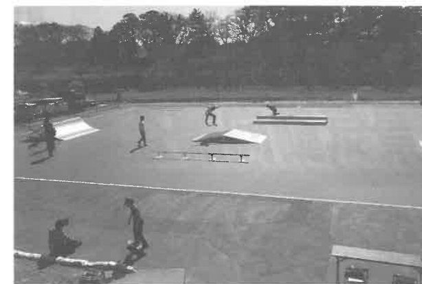
「リリースペイントHG」を塗布した ローラースポーツ場

—— 機能商品とは具体的にどんなものですか 機能商品事業では、防虫分野と景観分野という2つの事業に注力しています。